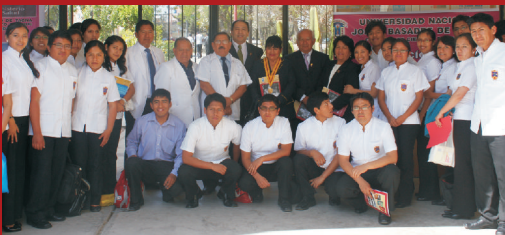
Autoridades, docentes y estudiantes presentes en el aniversario de esta carrera profesional.