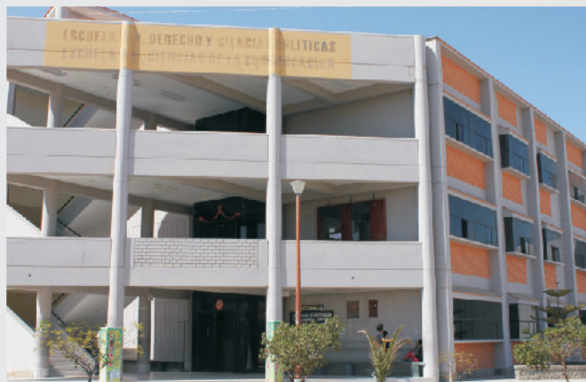
Frontis de la E.A.P. de Ciencias de la Comunicación.

Primer componente "Acondicionamiento de la infraestructura existente para el equipamiento de la E.A.P. de Ciencias de la Comunicación", que comprende en mejorar y acondicionar las instalaciones sanitarias, eléctricas, columnetas, vigas collarines y